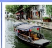
เมืองโบราณหนานสวิน