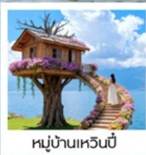
หมู่บ้านเหวินปี้

เมืองโบราณต้าหลี่ / นั่งเรือสู่เกาะเสี้ยวผู่ / ซานโตรินี่ (รวมรถแบตเตอรี่) / ถนนทางเออร์ต้าต้า / ภูเขาอินเซียงซาน / ต้าซ่าท่าเรือหลงกัน โค้ง S ทะเลสาบเอ้อไห้ / หมู่บ้านโบราณสี่จิว / หมู่บ้านเหวินปี้ / ชมดอกไม้ตามฤดูกาล