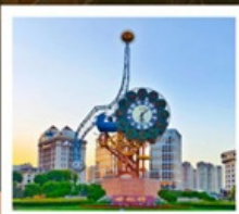
นาฬิกาตวรรษ