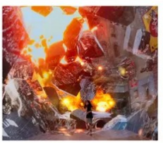
SPACE & TIME CUBE