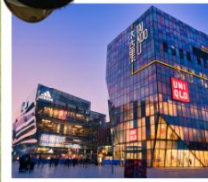
ย่านซานหลี่ตุ่น