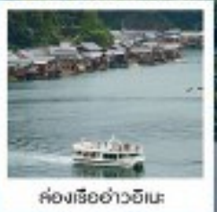
ค่องเรือฮอนอ่าวฮิเมะ