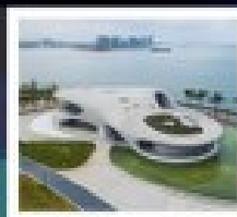
หอสมุดหยุนหลง