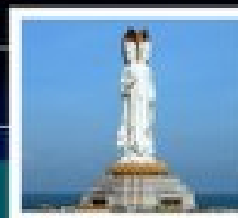
เจ้าแม่กวนอิมเทพนิรมิต