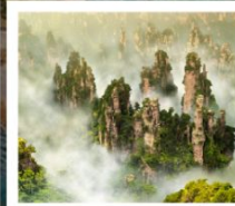
เซาอวตาร