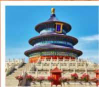
หอบูชาเทียนถาน