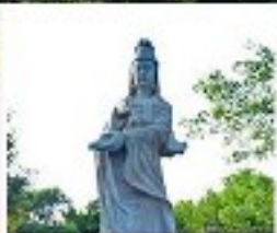
เจ้าแม่ทับทิม