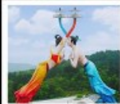
WULONG FLYING KISS