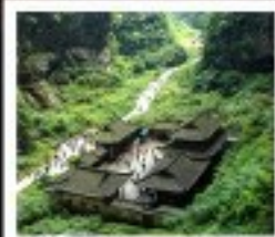
หลุมฟ้า สะพานสวรรค์

พระพุทธรูปทะเลสาบ / หมู่บ้านโบราณฉือตี่ยว อุทยานหลุมฟ้าสะพานสวรรค์ / ระเบียงกระจก / อุทยานเมฆนางฟ้า ภูเขาโม่โกะ / Wulong Flying Kiss / เข็มปักถนนคนเดินเซี่ยฟางเป่ย์ เข็มปักหงหยาดัง / มหาศาลประชาชน / เข็มปักไฟฟ้ากระดูก ถนนโบราณจีนแท้ / ศูนย์หมีแพนด้า