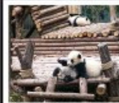
ศูนย์หมีแพนด้า

บริการรถไฟความเร็วสูงจาก จงชิ่ง - เจิงตู