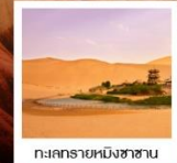
ทงลทรายหมิงซาซาน

ทัวร์คุณธรรม ไปลงร้านช้อปปิ้ง • ไปชായออฟชั่น