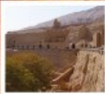
ถ้ำพระผืนธง

ถู่หลู่ฟาน / ตุนหวง / จางเย่ / หลานโจว / อุหลู่มู่ฉี / เจิงตุ