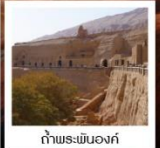
ถ้ำพระพันองค์