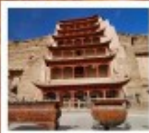
ถ้ำม่อเกาถู