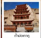
ถ้ำม่อเกาคู