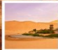
ทะเลทรายหมิงซาซาน