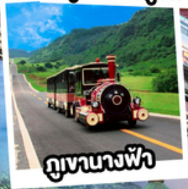
ภูเขาทางฟ้า