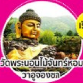
วัดพระนอนไม้จันทร์หอมวาจุงจองชา