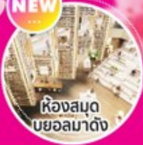
ห้องสมุดบยอลมาดัง