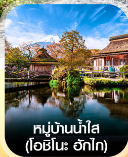
หมู่บ้านน้ำใส (โอชิโนะ วิกโก)

✈️ คอนเฟิร์ม ออกเดินทาง ทุกพีเรียด 2 ท่านขึ้นไป