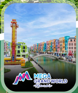
ไฮไลท์ทั้งหมด