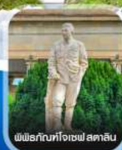
พิพิธภัณฑ์โจเซฟ สตาลิน