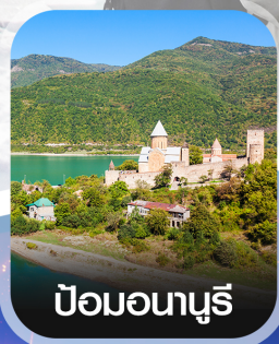
ปอนอนาซูรี

คอนเฟิร์มออกเดินทาง ทุกพีเรียด 2 ท่านขึ้นไป