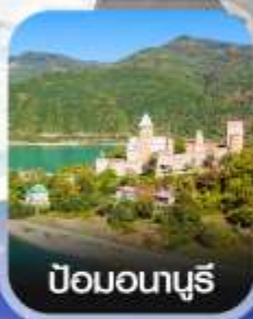
ป้อมอนาบุรี