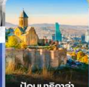
ป้อมนาริคล่า