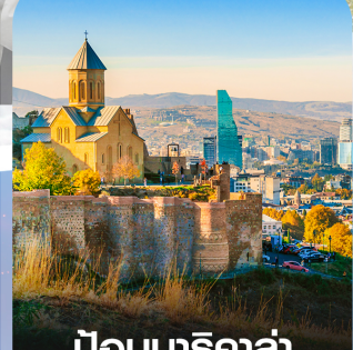
ปอนนาริกาล่า