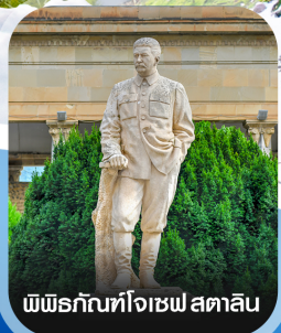
พิพิธภัณฑ์โจเซฟ สตาลิน