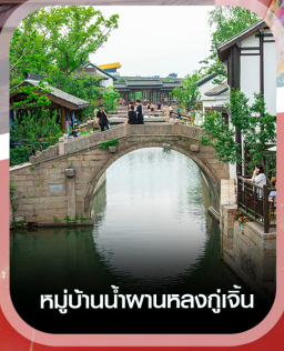
หมู่บ้านน้ำผานหลงกู่เจิน