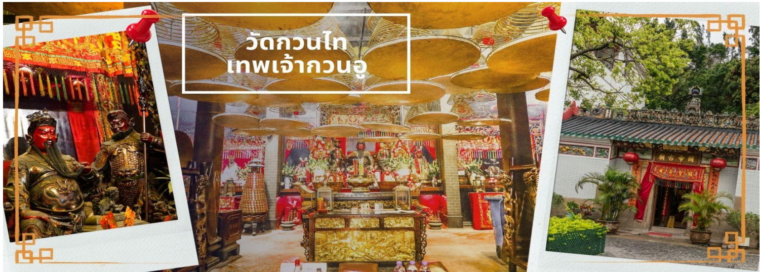
วัดกวนไท เทพเจ้ากวนอู

จากนั้นนำท่าน ไหว้ขอพรเรื่องเดินทาง การติดต่อ ค้าขาย วัดเจ้าแม่ทับทิมทินหัว (Tin Hau Temple) ที่ Yau Ma Tei เป็นวัดเก่าแก่ขนาดเล็ก อายุกว่า 150 ปี มีต้นกำเนิดมาจากวัดเล็กๆ ใน พื้นที่ตลาด Kwun Chung เคยเป็นหมู่บ้านชาวประมงมาก่อน ตั้งแต่ปี 1864 เป็นวัดที่อุทิศให้กับทินโหว่ (หมาจิ้งจอก เทพเจ้าแห่งท้องทะเล) มีบรรยากาศที่สงบ ร่มรื่น ติดกับสวนสาธารณะเล็ก ๆ และนักท่องเที่ยวยังไม่พลุกพล่านมากจุดเด่นที่แนะนำคือ การปิดทองเรือมังกร เพื่อการงานการค้า ธุรกิจ ให้เจริญรุ่งเรือง