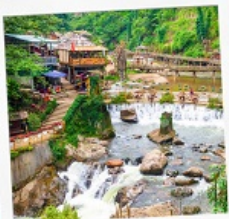
หมู่บ้านก๊อตก๊อต