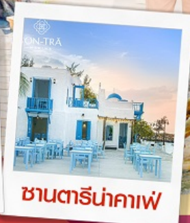
ซานตารีนาคาเฟ่