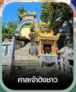
ศาลเจ้าติงซาอว