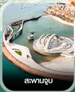
สะพานจูบ