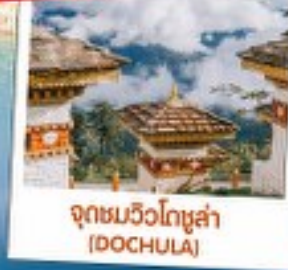
จุดชมวิวดอชูล่า (DOCHULA)