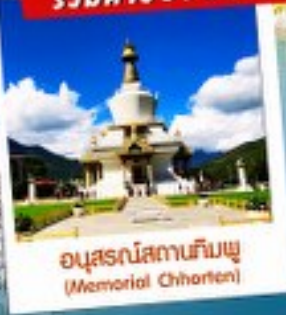
อนุสรณ์สถานทิมพู (Memorial Chorten)