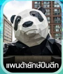
แพนด้ายักษ์ป็นตึก