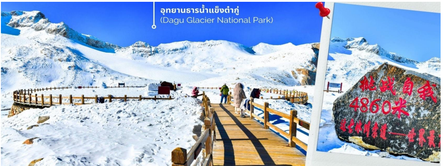
การตกและความหนาวของหิมะขึ้นอยู่กับสภาพอากาศ

จากนั้นนำท่านเดินทางสู่ เมืองเฮยสุ่ย (ใช้เวลาเดินทางประมาณ 2.5 ชั่วโมง) เพื่อเดินทางไปยัง อุทยานธารน้ำแข็งต้ากู่ปังชว่น (รวมกระเช้าขึ้นลง) ต้ากู่ปังชว่น หรือ Dagu Glacier National Park เป็นธารน้ำแข็งกลางเข็วที่สวยงามที่สุดแห่งหนึ่งของโลก และเป็นสถานที่ท่องเที่ยวระดับ 4A ของจีน ตั้งอยู่ที่เมืองเฮยสุ่ย ในมณฑลเสฉวน ห่างจากเมืองเฉิงตูประมาณ 300 กิโลเมตร ถือเป็นธารน้ำแข็งที่อายุน้อยที่สุด ที่ตั้งอยู่ในระดับความสูงที่ต่ำที่สุด และอยู่ใกล้กับเมืองมากที่สุดในบรรดาธารน้ำแข็งทั้งหมด โดยอยู่สูงจากระดับน้ำทะเลประมาณ 3,800-5,100 เมตร จุดสูงที่สุดที่นักท่องเที่ยวสามารถขึ้นไปได้จะอยู่ที่ 4,860 เมตร