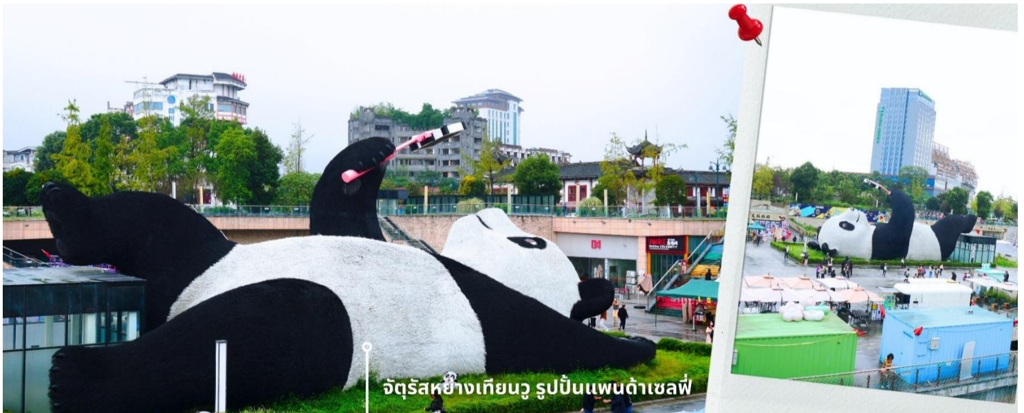
จัตุรัสหยางเทียนวู รูปปั้นแพนด้าเซลฟี่

นำท่านเที่ยวชม จัตุรัสหยางเทียนวู เป็นจุดเช็คอินที่สำคัญสำหรับคนที่มาเที่ยวที่ เมืองตูเจียงเยียน บริเวณจุดท่าข้าม อำเภอตูเจียงเยียน นครเฉิงตู ไฮไลท์ของจัตุรัสหยางเทียนวู คือ ประติมากรรม แพนด้ายักษ์ที่กำลังนอนหงายท้อง ยื่นมือถือไม้เซลฟี่สีชมพู ซึ่งออกแบบโดยนักออกแบบชื่อดัง Florentijn Hofman รูปปั้นแพนด้า ยักษ์มีความยาว 26 เมตร กว้าง 11 เมตร สูง 12 เมตร และหนัก 130 ตัน แบบท่าทางสบายๆของแพนด้าที่สร้างความประทับใจและ รอยยิ้มให้กับผู้มาเยือนจัตุรัสหยางเทียนวู สามารถดึงดูดนักท่องเที่ยวได้เป็นจำนวนมากเลยทีเดียว เป็นการ แสดงออกด้วยภาษาทางศิลปะแบบหนึ่งที่สะท้อนชีวิตในท้องถิ่น มอบความรู้สึกสนิทสนมและมีความสุขกับผู้ชม อิสระเดินชมถ่ายภาพ รูปปั้นแพนด้าเซลฟี่ ตามอัธยาศัย ที่นี่เป็นจุดเช็คอินที่เหมาะสมสำหรับทุกเพศทุกวัย หากคุณ กำลังมองหาสถานที่ท่องเที่ยวใหม่ๆ ที่เต็มไปด้วย ความทรงจำดี จัตุรัสหยางเทียนวู คือคำตอบที่สมบูรณ์แบบ