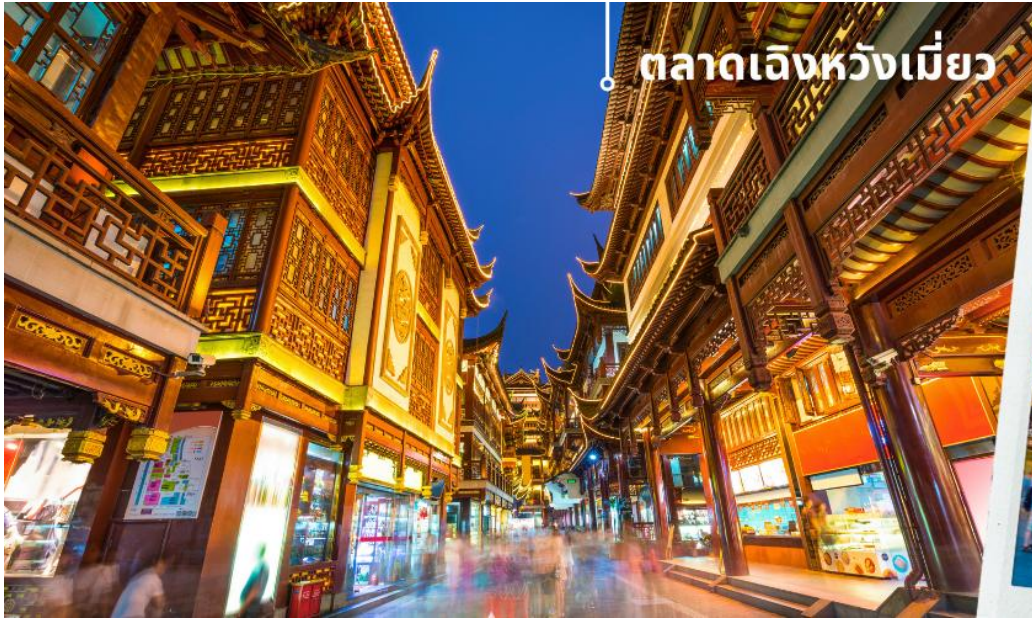
ตลาดเจิ้งหวังเหมียว

นำท่านเดินทางกลับสู่มหานครเชียงใหม่ โดยใช้เวลาเดินทางประมาณ 2 ชั่วโมง จากนั้นนำท่านชม ตลาดเจิ้งหวังเหมียว หรือเป็นที่รู้จักในชื่อ ตลาด 100 ปี เจินหวังเหมียว เมืองเซียงไฮ้ (Chen Wang Miao) ถือว่าเป็นตลาดเก่าของผู้ตั้ง เมืองเซียงไฮ้ อาคารบ้านเรือนบริเวณนี้เป็นสถาปัตยกรรมโบราณสมัยราชวงศ์หมิงและชิง ตกแต่งสไตล์สถาปัตยกรรมแบบโบราณจีน และเก่ากว่าร้อยปี