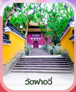
วัดฟาอวี