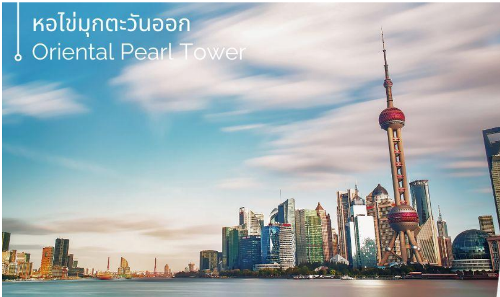
หอไข่มุกตะวันออก Oriental Pearl Tower

จากนั้นนำท่านเดินทางสู่แลนด์มาร์คของเมืองเซียงไฮ้ นักท่องเที่ยวทั้งชาวจีนและชาวต่างชาติ ต่างพากันมาถ่ายรูปอย่างไม่ขาดสาย เมื่อมาถึงเมืองเซียงไฮ้ นั่นคือ หอไข่มุกตะวันออก Oriental Pearl Tower (ผ่านชม) เป็นหอส่งสัญญาณวิทยุโทรทัศน์สูง 468 เมตร ลักษณะเป็นไข่มุก 11 ลูก และ เสา 3 เสา ด้านบนเป็นรูปไข่มุก 3 เม็ด 3 ขนาดเรียงกันในแนวตั้ง เมื่อชมวิว ถ่ายรูปกันจนหน้าใจแล้ว นำท่านเดินมาทางเข้าอุโมงค์เลเซอร์ ซึ่งเป็นอุโมงค์ลอดแม่น้ำแห่งแรกในประเทศจีนโดยอุโมงค์นี้จะพาเราเดินทางข้ามจากฝั่งหอไข่มุกตะวันออก ของหาดไว่ทาน