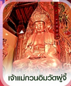
เจ้าแม่กวนอิมวัดฟูจี้

✈️ คอนเฟิร์มออกเดินทาง ✈️ ทุกพีเรียด 2 ท่านขึ้นไป