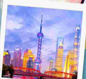
ทาดว่ายกาน