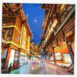
ตลาดเดินหัวงเมี่ยว