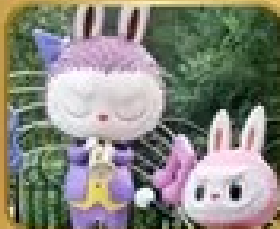
เที่ยวสวนสนุก