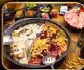
พิกเก็ต มื้อกลางวัน ซูชิ มื้อไฟลิตส์ริบ