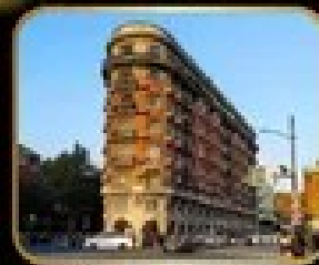
ตึกหรู 3 มื้อ WUKANG MANSION