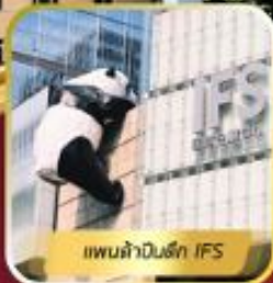
แพนด้าในตึก IFS