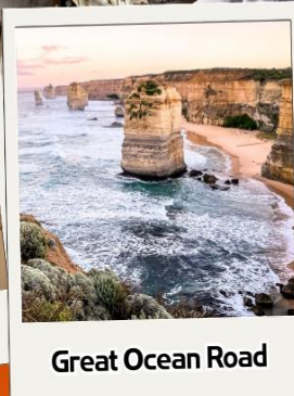
Great Ocean Road