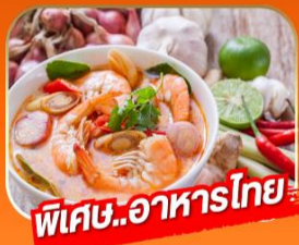
พิเศษ..อาหารไทย

1 - 5 เม.ย. / 29 เม.ย. - 3 พ.ค. 69 27 - 31 พ.ค. 69