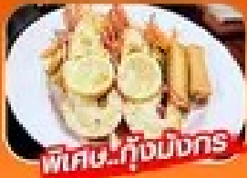
พิเศษ! กุ้งมังกร

1 - 5 เม.ย. / 29 เม.ย. - 3 พ.ค. 69 27 - 31 พ.ค. 69