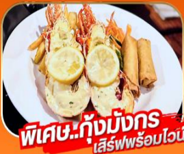
พิเศษ..กุ้งมังกร เสิร์ฟพร้อมไวน์