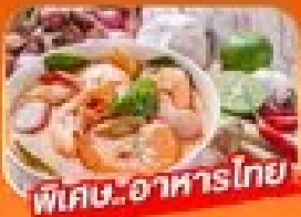
พิเศษ! อาหารไทย