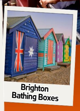
Brighton Bathing Boxes