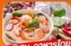
พิเศษ อาหารไทย

1-6 พ.ค. / 30 พ.ค. - 4 มิ.ย. 69 25 - 30 มิ.ย. 69