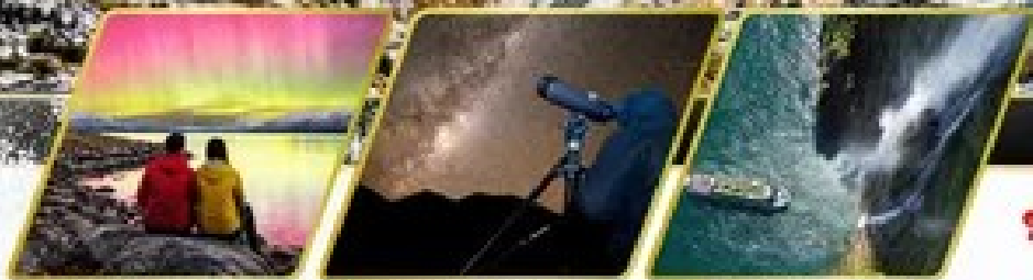
ตามล่าหาแสงใต้