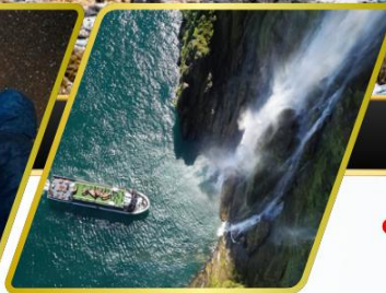
ล่องเรือมิลฟอร์ด ซาวน์