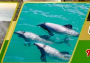
ส่องเรือชมโลมา