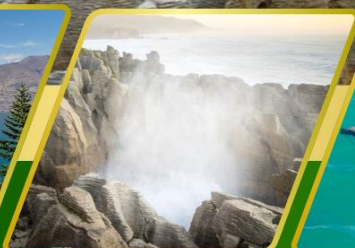
ไปโฮ, แพนเค็กหรือค