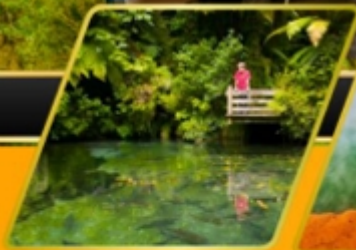
พาราไดซ์ สปริงส์ วิลเลจ