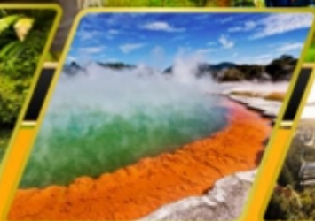
น้ำพุร้อน WAI-O-TAPU