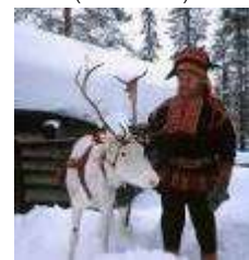
Local (155 ก.ม.)

09.00 น. ออกเดินทางตลอดอุโมงค์กลับสู่ฝั่งแผ่นดินใหญ่ ณ ดินแดนตอนเหนือของประเทศฟินแลนด์ ที่เรียกว่าเขตฟินน์มาร์ก หรือเขตแลปป์แลนด์ บริเวณแถบนี้เป็นที่อยู่อาศัยของชาวแลปป์ หรือ อีกชื่อหนึ่งคือซามิ (Sami) นำคณะข้ามพรมแดนสู่ประเทศฟินแลนด์เมืองคาราสจอก