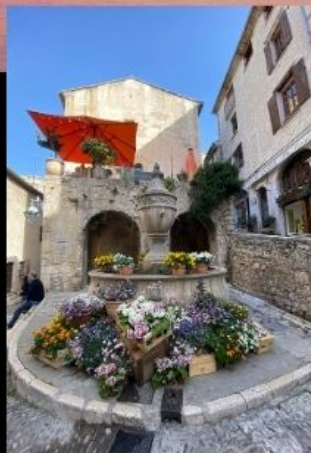
พรอวองซ์