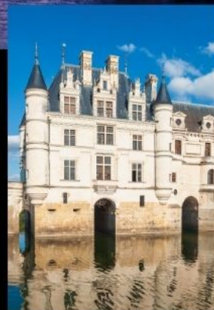
ปราสาทลุ่มแม่น้ำลัวร์