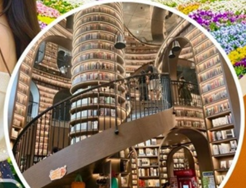
จงซูเก๋อ