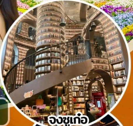
จงซูเก๋อ

สวนสวรรค์แห่งดอกไม้ MANHUA-จงซูเก๋อ-จัดรู้อย่างเทียนวู-รูปปั้นแพนด้าเซลล์ เมืองโบราณกวนเซี่ยน-อุทยานเขาสิดรุณี(รวมรถอุทยาน)-สะพานหนานเจียว เมืองลั่วใต้-ตึกแฝด-SKP-วัดต้าจื่อ-ถนนคนเดินซุนซีลู่-IFS-ตงเจียวจี้-ถนนคนเดินไท่กุหลี่