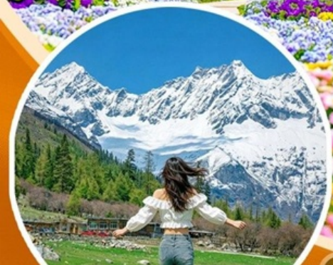
ภูเขาสี่ดรุณี ช่วงเลี้ยวโกว (รวมปรดอุทยาน)