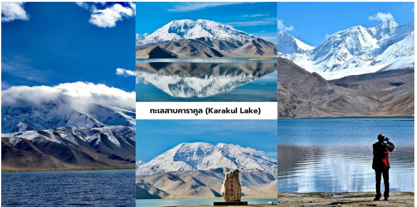
ทะเลสาบคาราคูล (Karakul Lake)

นักท่องเที่ยวสามารถเดินชมทัศนียภาพรอบทะเลสาบและสัมผัสบรรยากาศธรรมชาติของที่ราบสูงปามีร์ที่เจียบสงบ ถือเป็นหนึ่งในจุดชมวิวกูเขาหิมะและทะเลสาบที่สวยงามที่สุดของเส้นทางสายปามีร์