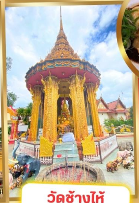
วัดช้างไห้