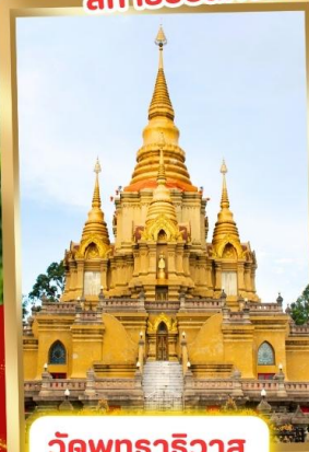
วัดพุทธาริวาส