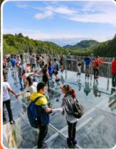
ระเบียงแก้วอุ๋หลง