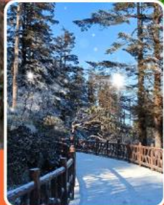
ภูเขาหว่าอูซาน