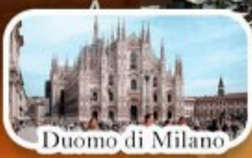
Duomo di Milano