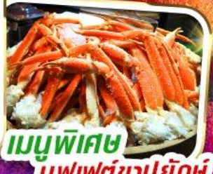
เมนูพิเศษ บุฟเฟต์ซาปูยักษ์

ราคาเพียง 35,999 *รวมภาษีมูลค่าเพิ่มแล้ว*