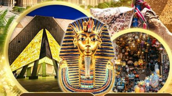
พิพิธภัณฑ์แกรนด์อียิปต์ Khan el-Khalili

เข้าชม 2 พิพิธภัณฑ์ GRAND EGYPTIAN MUSEUM & NMEC พิพิธภัณฑ์โบราณคดีใหม่และพิพิธภัณฑ์จัดแสดงมัมมี่