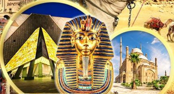
พิพิธภัณฑ์แกรนด์อียิปต์ บิอมปรการชาลาติน

เข้าชม 2 พิพิธภัณฑ์ GRAND EGYPTIAN MUSEUM & NMEC พิพิธภัณฑ์โบราณคดีใหม่และพิพิธภัณฑ์จัดแสดงมัมมี่