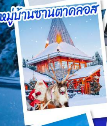
หมู่บ้านซานตาคลอส