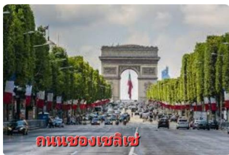
ถนนชองป์เอลิเซ่