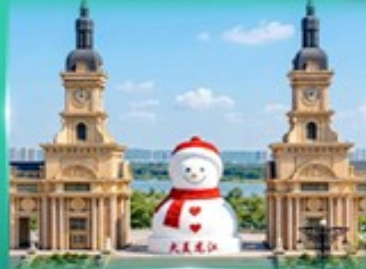
ตึกตาศิมะยักซ์ ฮาร์บิน