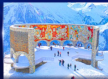
อนุสาวรีย์มิตรภาพ รัสเซีย-จอร์เจีย