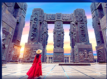
อุทยานประวัติศาสตร์จอร์เจีย