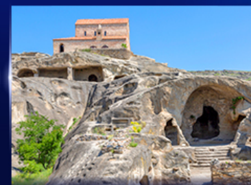
เมืองท่าโบราณ อุบลิสซิค