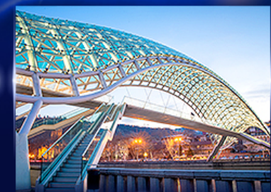
สะพานแห่งสันติภาพ ทบิลีซี