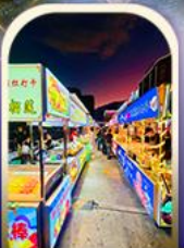
ตลาดอ็หึง