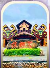
หมู่บ้านชนเผ่า